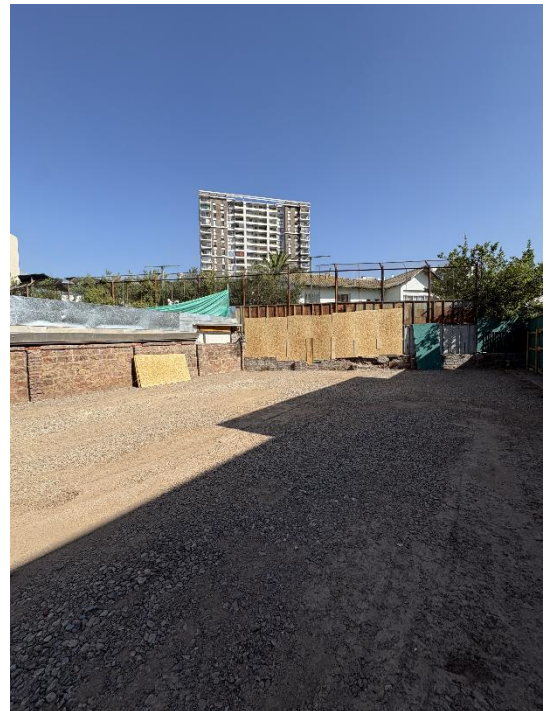
Compra de propiedad contigua para ampliación de superficie de patio. Esta es una donación de los rectores fundadores al Colegio. Proyecto en desarrollo.