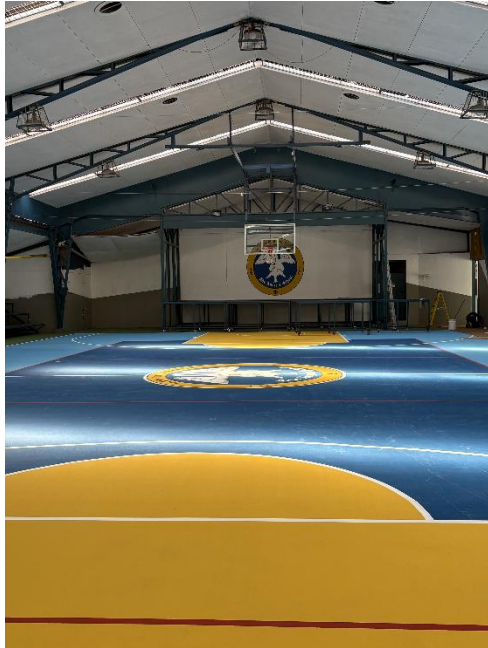
Recambio de superficie del Gimnasio 1

Durante el período de vacaciones de verano y durante las primeras semanas de clases, el equipo de Administración y Operaciones gestionó las siguientes mejoras en infraestructura que se encuentran concluidas y/o en desarrollo.