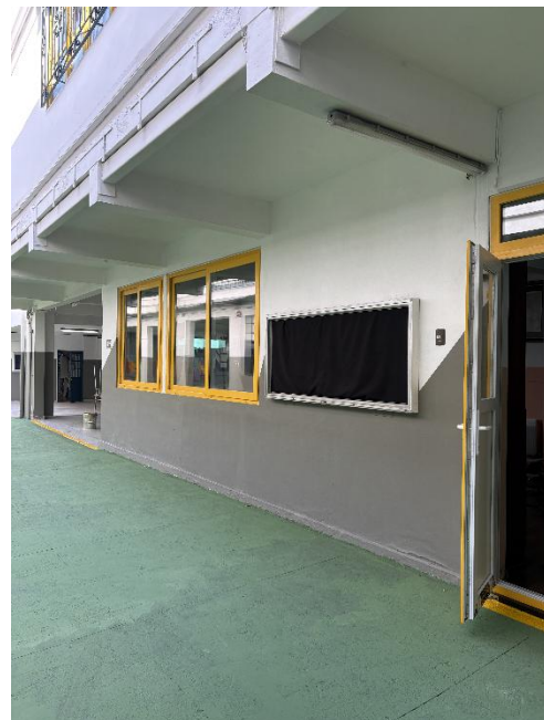
Instalación de ventanas y puertas de termo-panel en Biblioteca Julio Orlandi