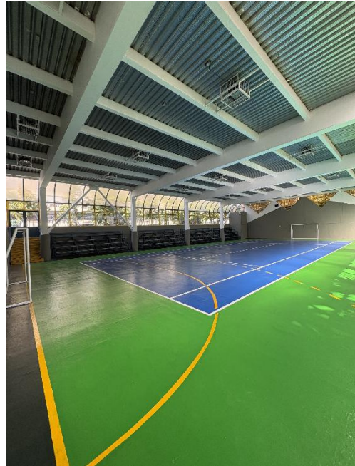
Repintado de superficie del Gimnasio 2