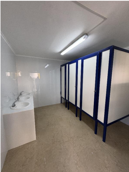
Renovación completa de ambos baños de 1° y 2° básico